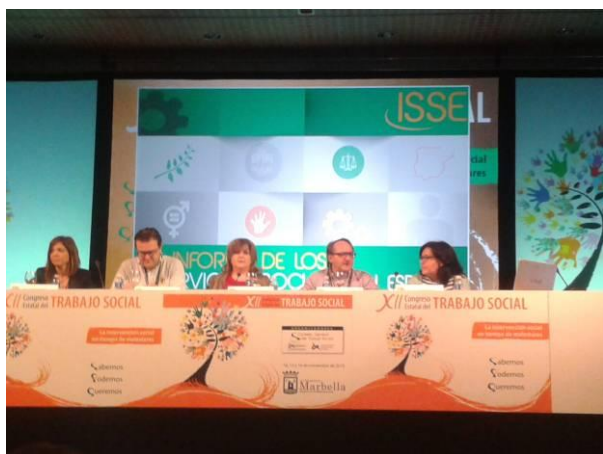
Mesa: El Sistema de Servicios Sociales.